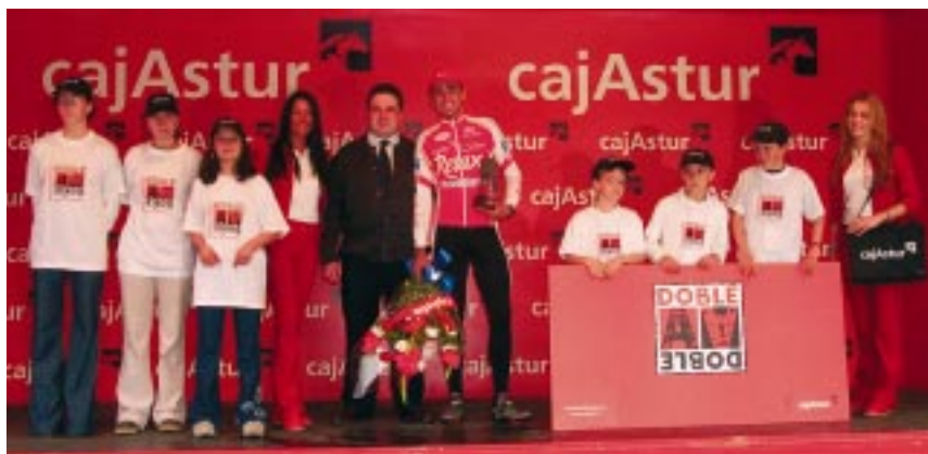
Vuelta Ciclista Asturias 2001

Uno de los mayores escaparates de nuestra tierra es la Vuelta Ciclista Asturias que todos los años se desarrolla con el patrocinio de Cajastur. Los impresionantes paisajes, unido a la dureza propia de este deporte, convierten la vuelta en un espectáculo sin igual seguido por multitud de aficionados.